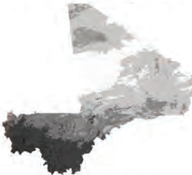
Figura 3. Cobertura sahariana y saheliana de Mali

Fuente: Scalea, D. 2013. Mali: Perché la guerra. Disponible en: http://www.geopolitica-rivista.org/2011/mali-perche-la-guerra/ .