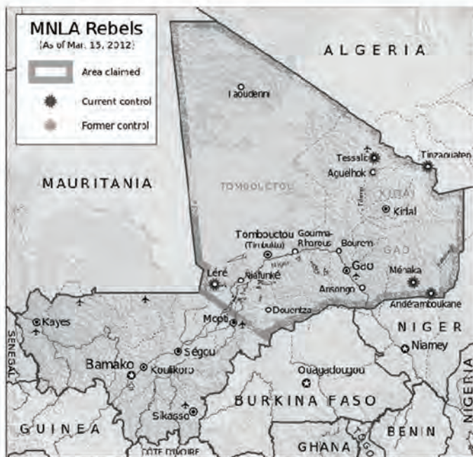
Figura 4. La región del Azawad