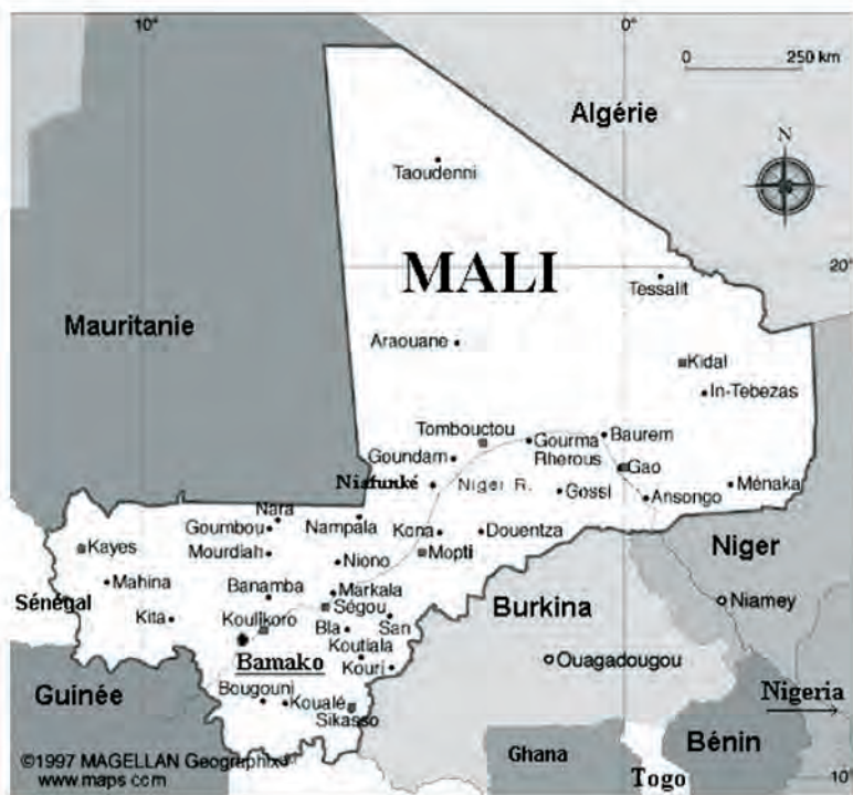
Figura 1. Situación geográfica de Mali