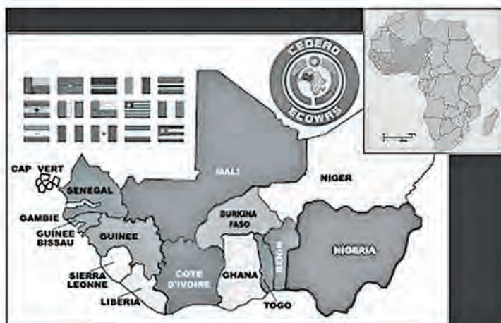
Figura 5. Mapa de los países miembros de la CEDEAO